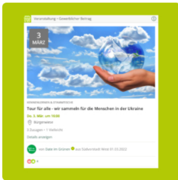
Sylke veröffentlicht kurzerhand eine Veranstaltung in ihrem Gewerbeprofil

sieht lässt sie das Schicksal der Betroffenen miteilen, sodass sie beschrieb selbst Unterstützung anzubieten.